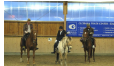
Die kleine Show des Fanclubs

Die Ostdeutschen sind immer noch so große Fans der Olsenbande, dass es heute einen Olsenbandenfanclub gibt. Der Fanclub existiert in Sachsen, und er hat über 350 Mitglieder - sowohl Erwachsene als auch Kinder, und die meisten Mitglieder kommen aus der ehemaligen DDR. Einige sind aber auch Westdeutschen 37 , obwohl die Olsenbande so große Popularität dort nicht erreicht hat. Man sagt, dass die Olsenbande Kult ist, und das Ziel des Olsenbandenfanclubs Deutschland die Erhaltung dieses Kults ist. Am 10. Oktober 2004 fand der erste Fanclubtreff statt, um den letzten Filmtag zu feiern, und darüber kann man auf die Internetseite des Fanclubs ( www.olsenbandenfanclub.de ) lesen. Auf dieser Homepage findet man auch vieles über die Olsenbande. Zum Beispiel gibt es viele Information über die verschiedenen Darsteller, und auch die Autogramme von Ove Sprogøe, Morten Grundwald und Poul Bundgaard sind dort zu finden. Die Homepage ist immer aktualisiert, und das derzeitige Thema ist den 70. Geburtstag von Morten Grundwald. In diesem Zusammenhang fordert der Fanclub die Fans auf, Glückwünsche an ihn zu schreiben. Als Ove Sprogøe im September starb, wurde auf der Homepage auch viel über ihn geschrieben. Man machte sogar eine kleine Show ihm zu Ehren. Ove Sprogøe war auch Mitglied des deutschen Fanclubs 38 .